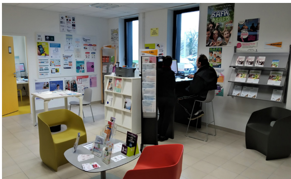
Visite de la Maison des Services de Pontchâteau (18/01/2022)

Le conseil des Sages a été saisi par la Ville afin d'obtenir un avis citoyen en vue de la création d'une maison des services publics.