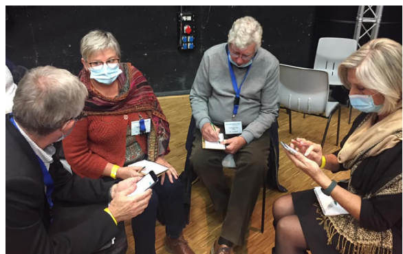
Echanges au congrès de Jeumont - nov.2021