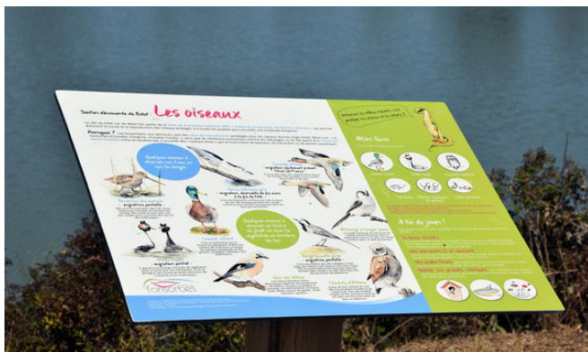
Avec panneaux pédagogiques présentant la biodiversité locale