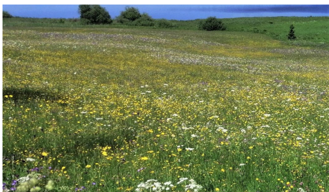
Exemple de prairie naturelle fleurie favorisant la biodiversité