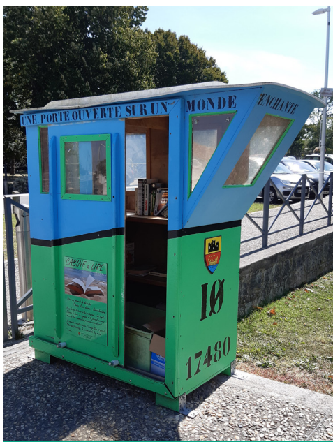
Exemple de boîte à livres (vue près du port de Château d'Oléron)

Notre objectif est de favoriser l'accès à la lecture pour tous, avec le partage des livres de toutes sortes et une plus grande circulation des ouvrages.