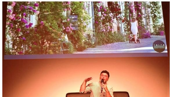
Revégétons la ville - Congrès de Jeumont - nov. 2021