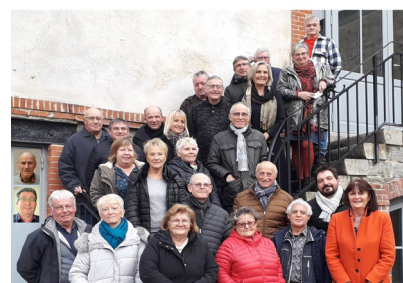
Le Conseil des Sages - Ouest-France 06.12.21

Le Conseil des Sages de Couëron rend hommage à Jacques Auxiette, décédé le 10 décembre 2021, qui fut à l'origine de la création de la Fédération des Villes et Conseils de Sages en 1993 avec Kofi Yamgnane.