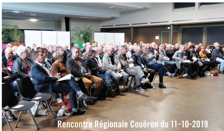
Rencontre Régionale Couëron du 11-10-2019