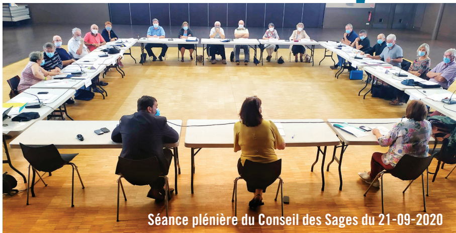
Séance plénière du Conseil des Sages du 21-09-2020