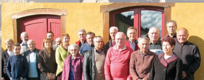
Installation du conseil des sages de Vignoc en présence de deux membres de la Fédération.

Le premier travail va consister à l'étude « Déplacements et aménagement du bourg ».