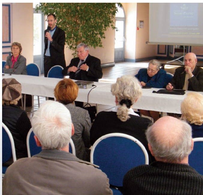
Une naissance perrotinne en présence de trois membres du conseil des sages de Rochefort.

La Fédération a été invitée par le Conseil général des Côtes-d'Armor à participer à la synthèse des travaux menés par les communes du département sur le thème : Côtes-d'Armor 2 mille 20, une nouvelle étape, celle de l'action. Cette rencontre fait suite à celle du 29 mai 2008 dans laquelle nous étions intervenus sur le sujet « Vivre ensemble l'intergénérationnel aujourd'hui ». Voir Mes Sages n° 7. Les membres du Conseil d'Administration ont rencontré des élus et des citoyens désireux de créer un conseil des sages ou de discuter de la vie de leur conseil : à Vignoc pour l'installation de leur conseil, au Pellerin (44), à Fay-de-Bretagne (44) lors d'un débat public, de même qu'à Bouaye (44), Saint-Malo-de-Guersac (44), Soyaux (16), Pont-L'Abbé-d'Arnoult (17) Aubigny (85) etc.