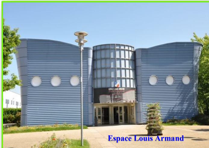
Espace Louis Armand

Pour une municipalité tout juste issue des élections municipales de mars 2014, l'organisation du Congrès a été une gageure, dont elle s'est brillamment sortie, en offrant aux participants, dans un cadre très ensoleillé, une atmosphère conviviale et une ambiance studieuse